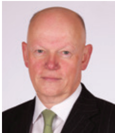
An Phríomh- Bhreitheamh, Donal O'Donnell Cathaoirleach Chomhairle na mBreithiúna

Is cúis áthais dom Tuarascáil Bhliantúil Chomhairle na mBreithiúna do 2022 a chur i láthair.