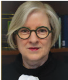
An Breitheamh Uasal Aileen Donnelly Cathaoirleach